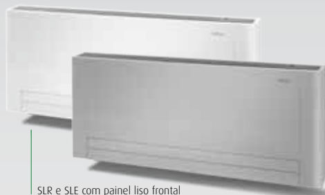
SLR e SLE com painel liso frontal