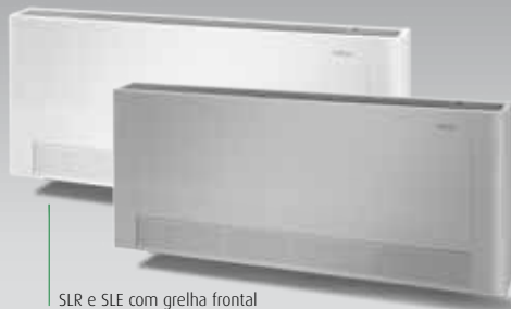
SLR e SLE com grelha frontal