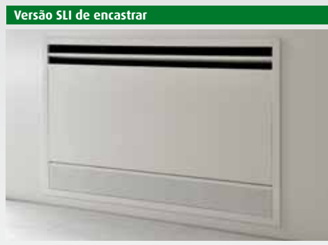
Versão SLI de encastrar