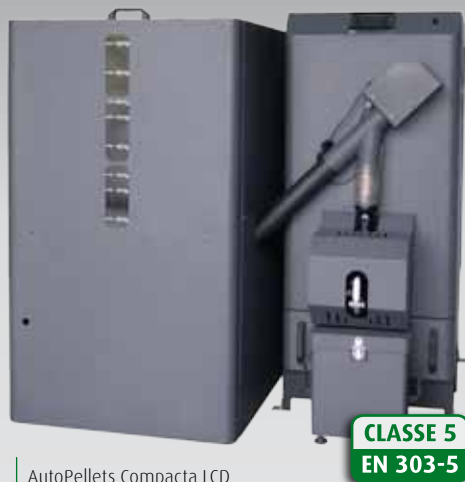
AutoPellets Compacta LCD